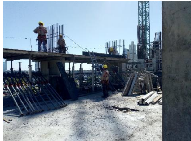
Se inició el entramado de losa s/12 sector Ciudad