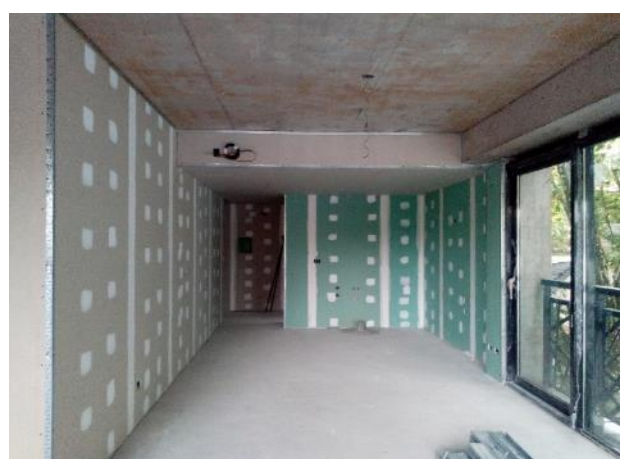
Colocación de placa de durlock en cielorraso