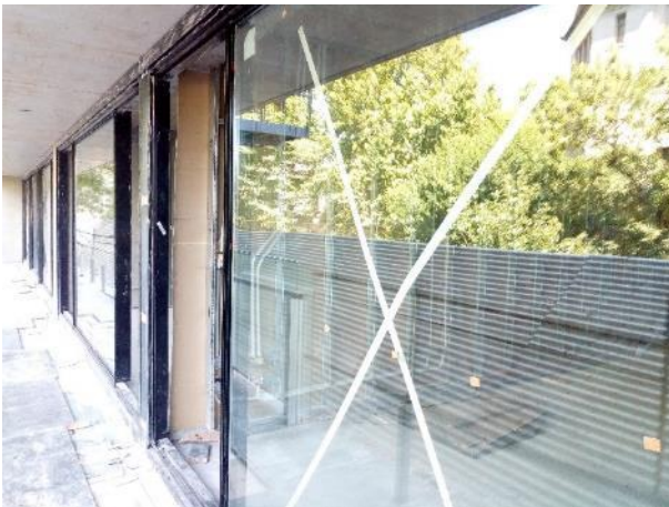
Inicio de colocación de vidrio en las carpinterías de aluminio en el 2do piso