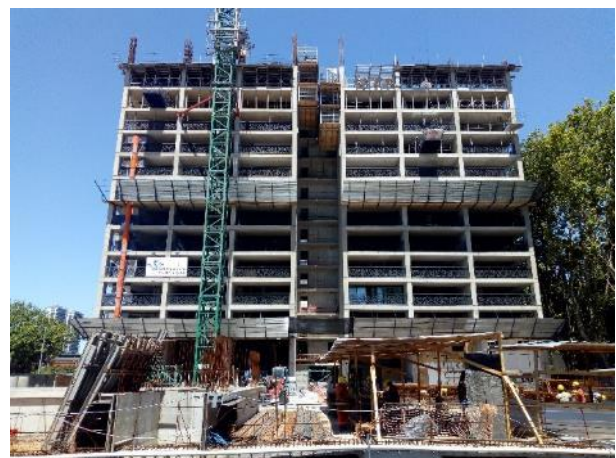
Vista de la obra desde la calle Venezuela