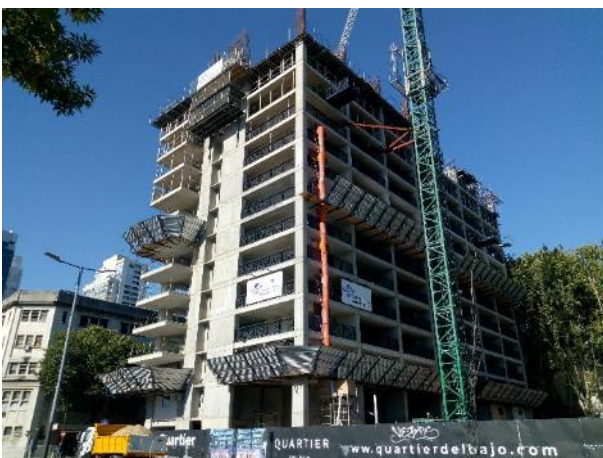
Vista de la obra desde Av. Huergo