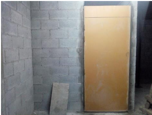
Iniciaron los trabajos de amure de las puertas de chapa en los SS