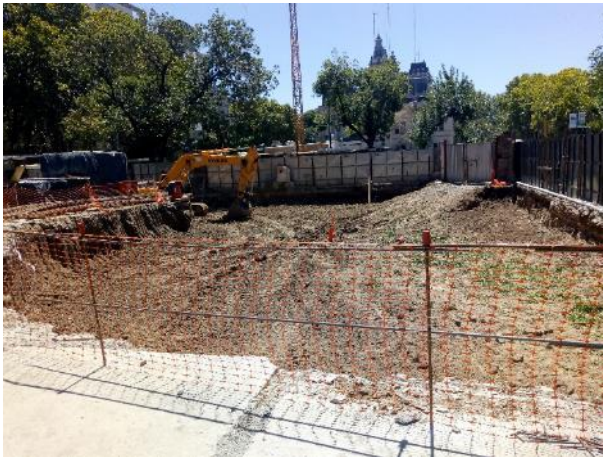
Continúa el avance de la excavación en la etapa 3