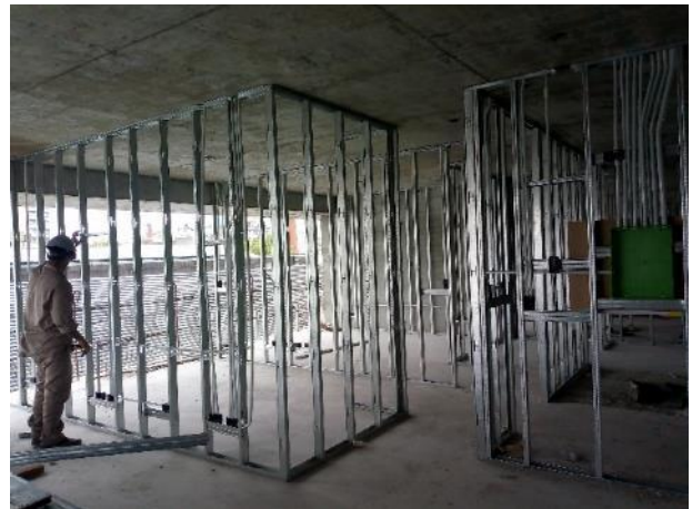
Avance de tendido de cañería eléctrica sobre estructura de durlock en piso 7