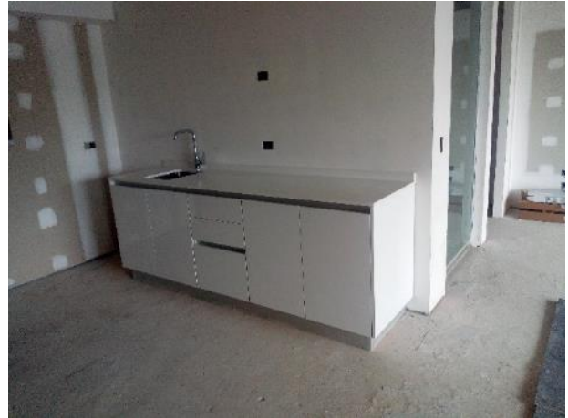
Colocación de mueble de cocina, con su bacha y grifería en el departamento piloto de obra