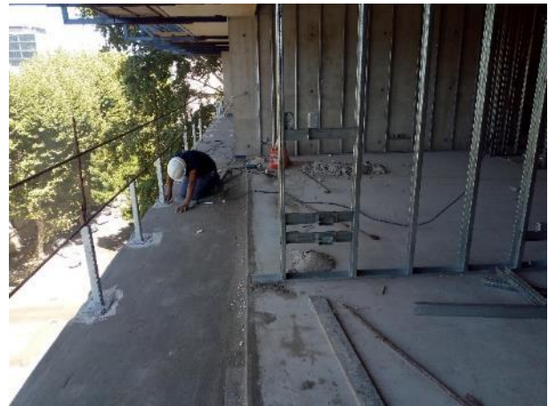
Colocación de parantes para baranda de aluminio en el piso 6