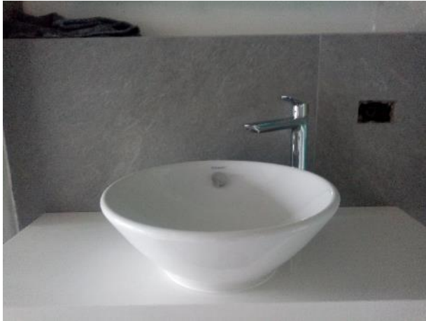
Mesada, bacha y grifería en el baño del departamento piloto de obra