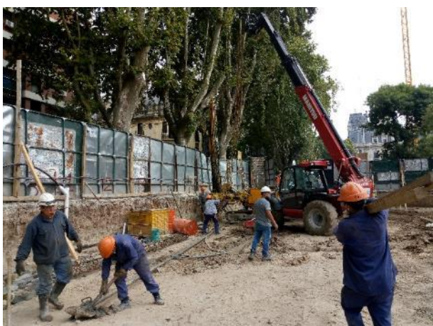
Inicio de los trabajos de pilotaje en la etapa 3a.