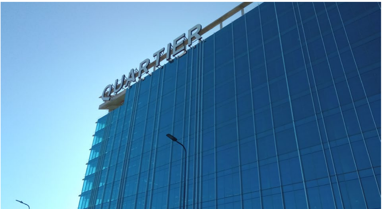
■ Montaje de paneles de curtain wall – Carpintería Metálica Orlando