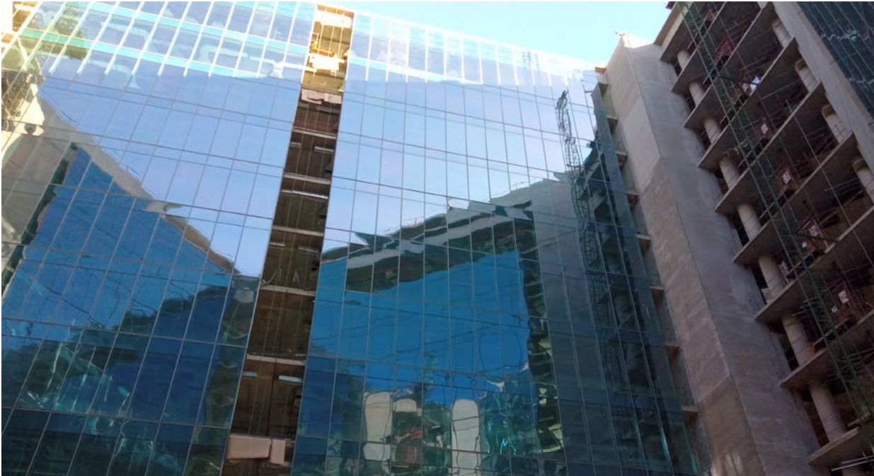
■ Montaje de paneles de curtain wall – Carpintería Metálica Orlando