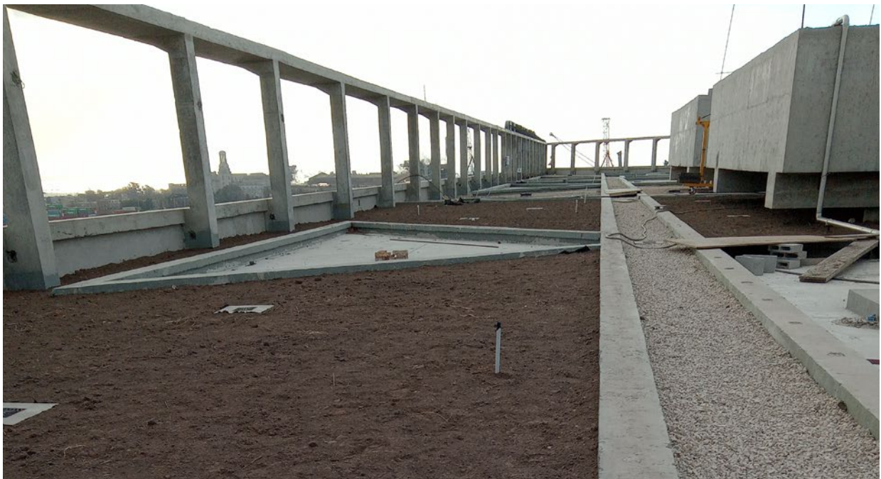
■ Colocación de tierra en sectores de canteros y piedra partida en circulaciones de Azotea – Subcontratista BARRETO