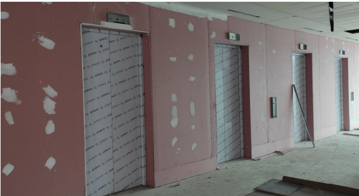
■ Montaje de Ascensores – Fujitec