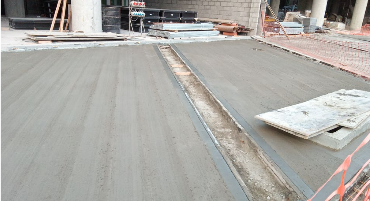
■ Hormigón escobrado en exteriores de Planta Baja- Subcontratista BRUNETTA