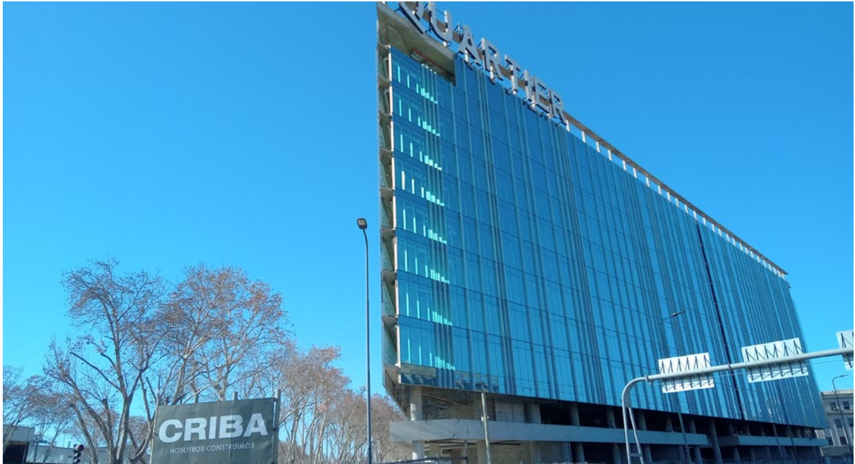
■ Vistas externas